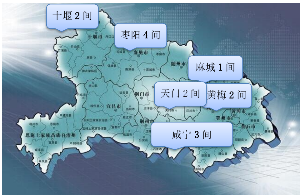
截至 2018 年 12 月，路石书屋总计

湖北省黄冈市黄梅县蔡山镇墩塘中心小学和湖北省襄阳市枣阳市北城街道书院街87号东园小学、湖北省咸宁市崇阳县铜钟乡中心小学、湖北省咸宁市崇阳县铜钟乡佛岭小学、湖北省咸宁市崇阳县铜钟乡独石小学、湖北省天门市干驿镇大湖小学、湖北省天门市干驿镇中和小学。书屋的建设内容包括图书室的软装、桌椅、书柜、投影设备、配置适合当地教师和青少年儿童阅读的书籍、以及部分具有有助于开发培养学生创新思维的教具，和当地师生一起创造儿童友好的阅读环境。